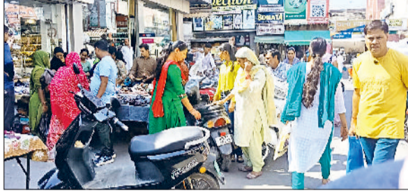
जींद। शहर में जगह-जगह लगाई गई सेल से सामान खरीदते ग्राहक।

दीपावली पर्व की शुरुआत हो चुकी है। शहर का ऐसा कोई कोना नहीं है, जहां दुकानदारों द्वारा सामान की बिक्री लेकर सेल न लगाई हो। शहर के गोहाना रोड, रानी तालाब पैदल पट्टी पर भी सामान बेचने वालों ने कब्जा कर लिया है। वहीं बाजार में दुकानदारों द्वारा भी अतिक्रमण कर लिया गया है। इस बार धनतेरस 18 अक्टूबर यानी शनिवार को मनाया जाएगा। खास बात यह है कि इस बार धनतेरस के दिन ही शनि प्रदोष व्रत भी पड़ रहा है। दोनों पर्व एक साथ आने से यह संयोग सौभाग्य