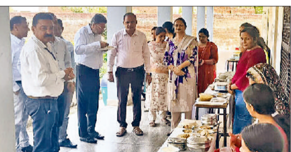
उचाना। एसडी महिला कॉलेज में आयोजित रसोई कार्यक्रम।