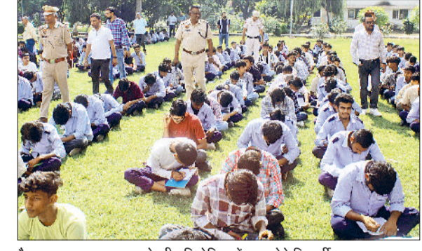
कैथल। सड़क सुरक्षा प्रश्नोत्तरी प्रतियोगिता में भाग लेते विद्यार्थी।