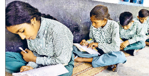
जीद। प्रतियोगिता में भाग लेते सरकारी स्कूल के बच्चे।

राजकीय माध्यमिक विद्यालय बरसाना में सड़क सुरक्षा विषय पर विशेष प्रतियोगिता का आयोजन किया गया। इसका उद्देश्य विद्यार्थियों में सड़क सुरक्षा के प्रति जागरूकता बढ़ाना और उन्हें