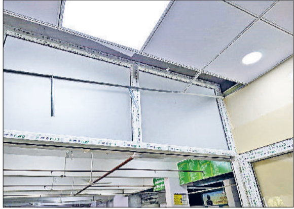
जीद। एमरजेंसी वार्ड में उखड़ी फॉल सीलिंग।