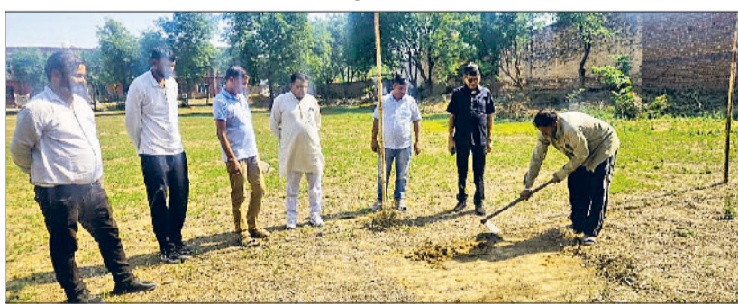
जींद। प्रतियोगिता के लिए मैदान तैयार करते खिलाड़ी।