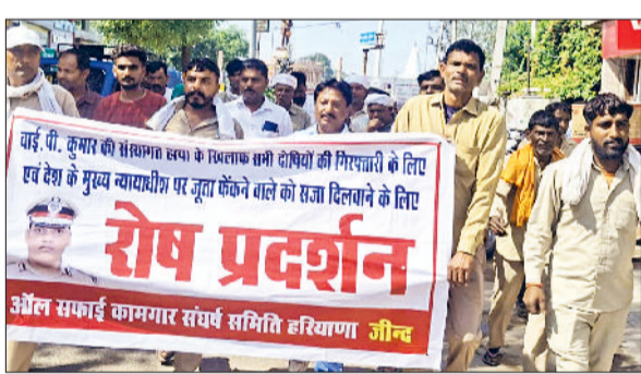
जीद। मांगों को लेकर प्रदर्शन करते हुए सफाई कर्मचारी।