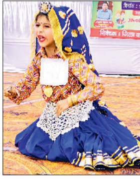
बढ़चढ़ कर भाग लेने के लिए प्रेरित किया।