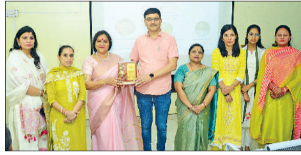
नरवाना। आर्य स्कूल में सम्मानित किए गए विद्यार्थी।